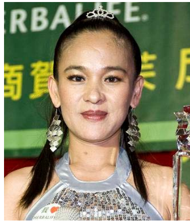
Tai Jui-Hsiang World Team TAIWAN