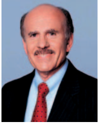
लुई इग्नारो, पीएच.डी., नोबेल पारितोषिक विजेते